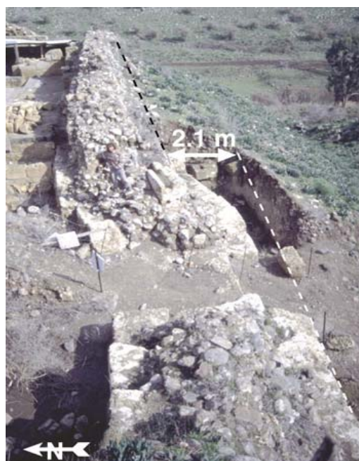
شکل ۲. جابه‌جایی ۲٫۱ متری دیواری از دژ کروسادر (Crusader)، کرانه خاوری مدیترانه. خط چین، محل اولیه دیوار را نشان می‌دهد (مارکو، ۲۰۰۸).