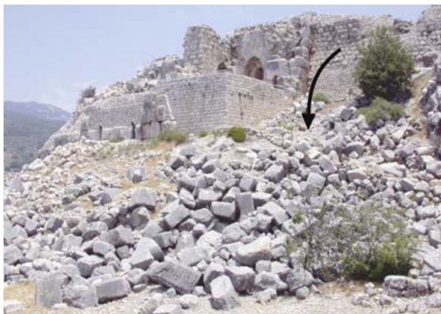
شکل ۶. دیوارهای فروریخته برج دیدبانی شمالی کل ات نیمرد (Kal'at Nimrod). کرانه خاوری مدیترانه (مارکو، ۲۰۰۸).

سنگفرش‌ها و دیوارهای ساخته شده از بلوک‌های سنگی بزرگ و یک شکل با مقطع مستطیلی را در بسیاری از بناهای با شکوه باستانی که همچنان پابرجا هستند می‌توان یافت که دیوار بزرگ چین نمونه بارز آن است. نیروهایی که هنگام زمین‌لرزه‌های بزرگ وارد می‌شود، ممکن است موجب جابه‌جایی و چرخش بلوک‌های عظیم موجود در این دیوارها و سنگفرش‌ها شود. این نوع عارضه از معمول‌ترین نوع خسارت زمین‌لرزه‌ای در بناهای باستانی است که در ساختارهای یادشده به‌خوبی قابل رؤیت است (شکل ۸).