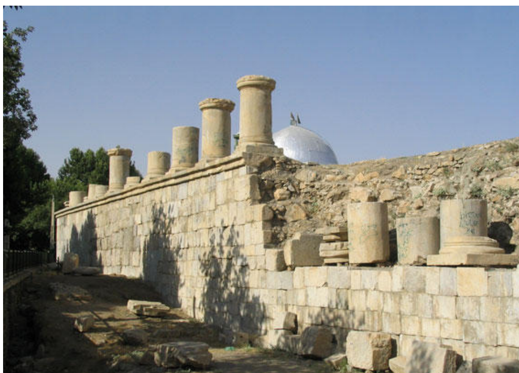
شکل ۵. سقوط ستون‌های سنگی معبد آناهیتا در کنگاور، کرمانشاه، ایران.