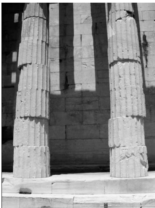
شکل ۱۲. چرخش و جابه‌جایی ستون‌ها حول محور قائم در هفایستئون (Hephaisteion) (تسئیون (Theseion))، آتن، یونان (بوتاری، ۲۰۰۵).