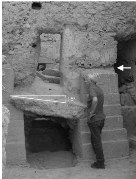
شکل ۱۱. واپیچش کف اتاقی در طبقه دوم کاخ فایستوس مینوان (Phaistos Minoan)، کریت (Crete)، یونان (موناکو و ترتریسی، ۲۰۰۴).

زمین‌لرزه‌ها همیشه منجر به سقوط و فروریزش ستون‌ها نمی‌شوند. گاه ممکن است که یک ستون یا بخش‌هایی از آن، حول محور قائم، دچار چرخش و جابه‌جایی شود (شکل ۱۲). با وجود این، برخی از این دگرشکلی‌ها که معمولاً پس از زمین‌لرزه‌های ویرانگر مشاهده می‌شوند