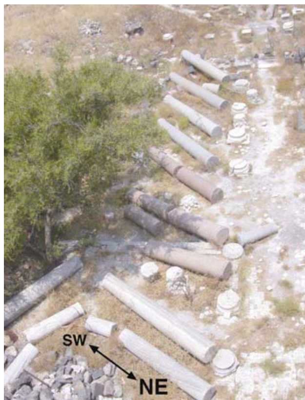
شکل ۴. سقوط جهت یافته ستون‌های یک کلیسا مربوط به اواخر دوره بیزانس در سوسیتا (Sussita)، کرانه خاوری مدیترانه (سگال، ۲۰۰۷).