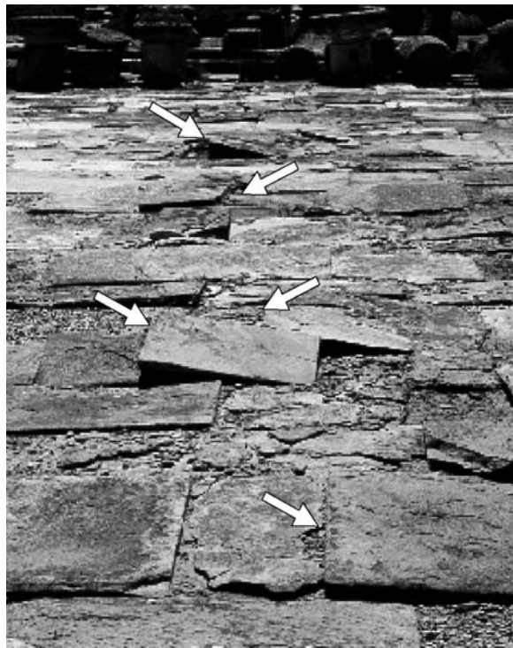
شکل ۸. بلوک‌های جابه‌جا شده در سنگفرش میدان بانلو کلودیا (Baello Claudia)، روم باستان، جنوب اسپانیا (سیلوا و همکاران، ۲۰۰۵).