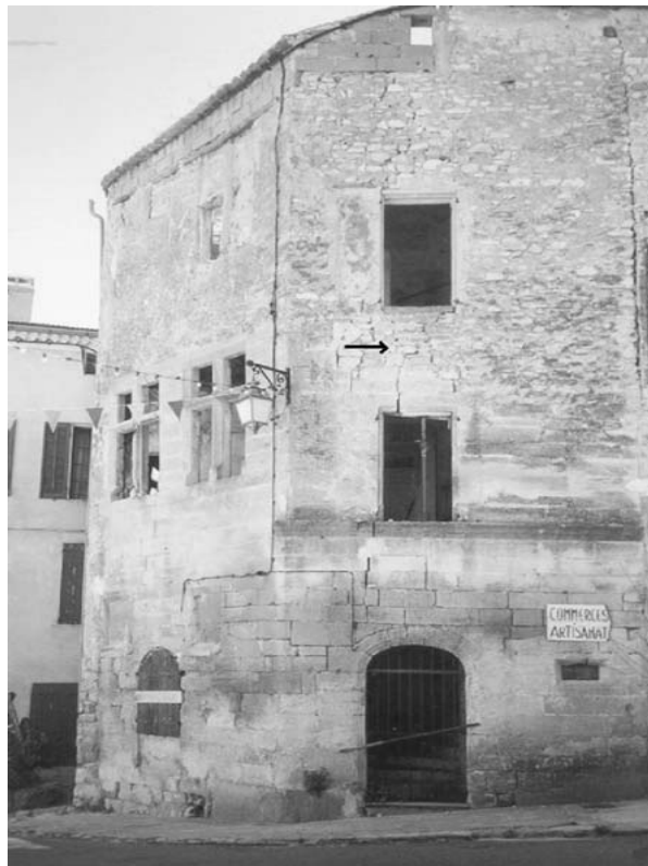
شکل ۷. شروع و پیشروی ترک‌خوردگی‌ها در گوشه پنجره‌ها در بنایی به سبک رونسانس، روستای سن‌میشل، فرانسه (پرسولپوس و همکاران، ۲۰۰۶).