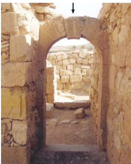
شکل ۹. سنگ سرتاق فرولغزیده در تاقی که به‌طور متقارن با دیوارها احاطه شده است (کامایی و هاتزور، در دست چاپ).

چنانچه یک تاق به شکل متقارن با دیوارهای مشابه احاطه شده باشد، تنها سنگ سرتاق (keystone) به پایین می‌لغزد (شکل ۸) (بوئبای و همکاران، ۱۹۹۸؛ بلاسی و فورابوشی، ۱۹۹۴؛ سینیپولی و همکاران، ۱۹۹۷؛ دلوکا و همکاران، ۲۰۰۴)؛ درحالی‌که اگر تاقی با دیوارهای متفاوت احاطه شده باشد، ممکن است یک یا چند بلوک از آن به سمت پایین بلغزد (شکل ۹) (کامایی و هاتزور، در دست چاپ).