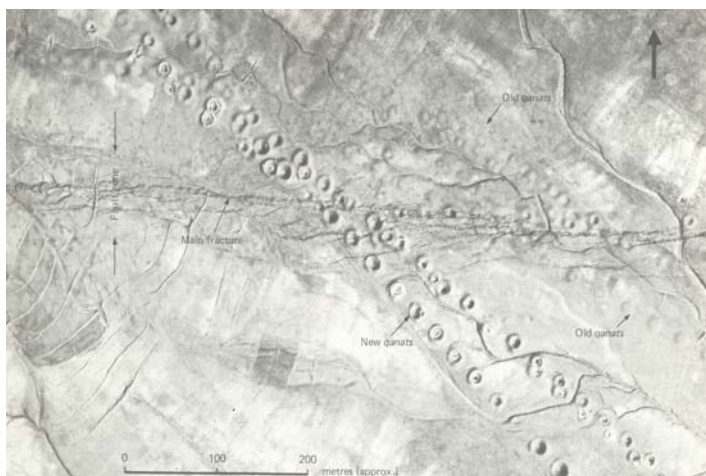
شکل ۱. جابه‌جایی قنات‌ها نشان دهنده فعال بودن زون گسلی فردوس در دوره‌های تاریخی است (آمبرسیز و ملویل، ۱۹۸۲). علامت پیکان در گوشه بالا سمت راست، جهت شمال را نشان می‌دهد.

گرچه تعداد اندکی از گسل‌های فعال جهان در تلاقی با محوطه‌های باستانی قرار دارند، اما اطلاعاتی که از بررسی آنها به دست می‌آید می‌تواند چشمگیر و جالب توجه باشد (نولر و لایتفوت، ۱۹۹۷).