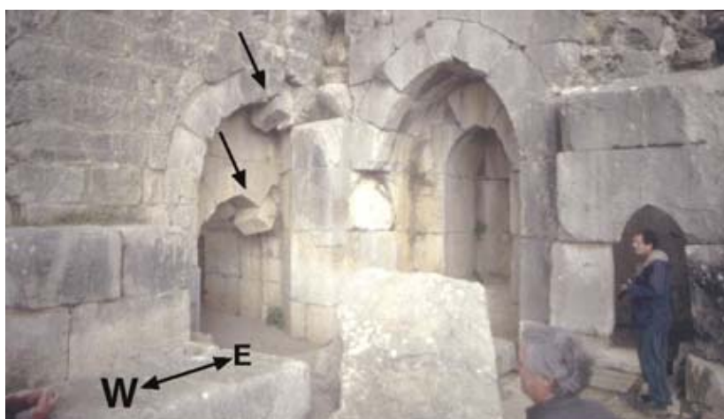
شکل ۱۰. بلوک‌ها در کناره تاق‌ها به سمت پایین لغزیده‌اند، کل ات نیمرد (Kal'at Nimrod)، کرانه خاوری مدیترانه (مارکو، ۲۰۰۸).