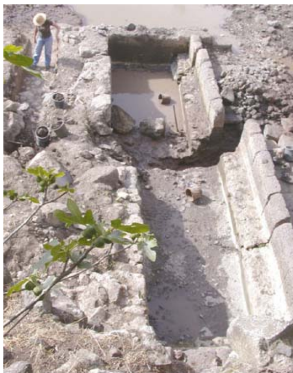
شکل ۳. نهر آب در اثر زمین‌لغزش زمین‌لرزه‌ای حدود ۱ متر به صورت چپ بر جابه‌جا شده است، ام الکناتیر، کرانه خاوری مدیترانه (وچسلر و همکاران، ۲۰۰۴).

در ایران، سقوط ستون‌های معبد آناهیتا در کنگاور ممکن است ناشی از جنبش زمین‌لرزه‌ای روی قطعه دینور-نهادند از گسل اصلی عهد حاضر زاگرس (Zagros Main Recent Fault (ZMRF) باشد (بربریان و بیتز، ۲۰۰۱) (شکل ۵). متأسفانه تجاوز به حریم این محوطه باستانی، و سرقت و جابه‌جایی ستون‌های فرو افتاده، امکان تشخیص جهت‌یافتگی در سقوط آنها را ناممکن ساخته است.